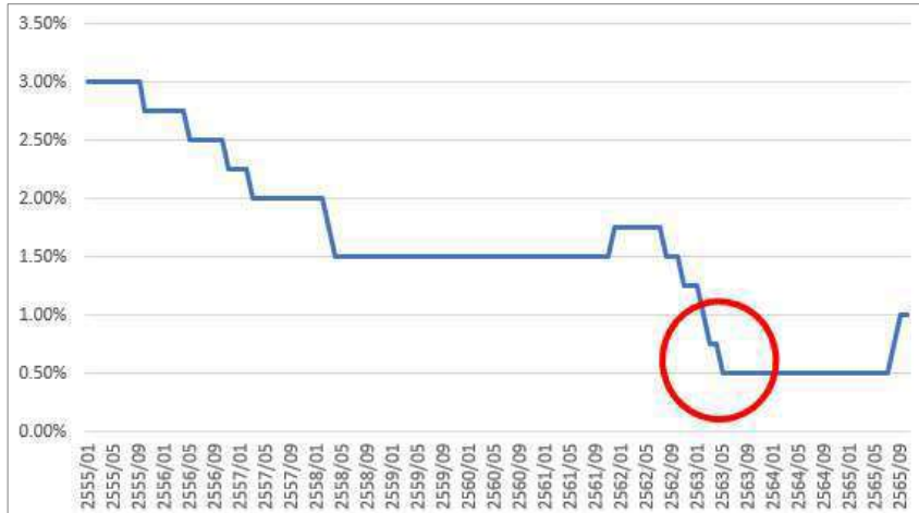
ภาพที่ 1 อัตราดอกเบี้ยนโยบาย ของประเทศไทย ตั้งแต่ พ.ศ.2555-2565

การปรับตัวลดลงของอัตราดอกเบี้ยเงินฝากของสถาบันการเงินต่างๆ ส่งผลกระทบทางตรงต่อผู้ที่ต้องการรับผลตอบแทนจากการลงทุนที่ปราศจากความเสี่ยง รวมไปถึงนักลงทุนที่ไม่ต้องการรับความเสี่ยงจากการลงทุนประเภทอื่นๆ ทำให้ผู้ลงทุนในการฝากเงินไว้ในสถาบันการเงินได้รับผลตอบแทนลดน้อยลงจากเดิม ประกอบกับในช่วงปี พ.ศ. 2563 เกิดการชะลอตัวของเศรษฐกิจทั่วทุกมุมโลกอันมีผลมาจากสถานการณ์การแพร่ระบาดของโรคระบาดโควิด-19 ที่ส่งผลกระทบเป็นวงกว้าง รวมไปถึงประเทศไทยก็ได้รับผลกระทบดังกล่าวเช่นกัน จึงทำให้ต้องมีการปรับลดอัตราดอกเบี้ยนโยบายลงเหลือเพียง 0.5% ต่อปี เพื่อเป็นการกระตุ้นเศรษฐกิจ ดังภาพที่ 1 ที่แสดงถึงอัตราดอกเบี้ยนโยบายย้อนหลังตั้งแต่ มกราคม พ.ศ.2555 จนถึง ธันวาคม พ.ศ.2565