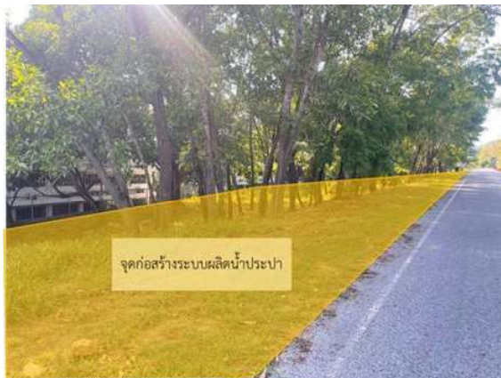
ภาพที่ 4 ภาพแสดงสถานที่จริงจุดก่อสร้างระบบผลิตน้ำประปา

การผลิตน้ำประปามีขั้นตอน เริ่มจากรับน้ำดิบจากเส้นท่อน้ำดิบของ Eastwater บริเวณสี่แยกศรีสุพรรณ เข้าสู่ระบบปรับ น้ำเพื่อกำจัดตะกอนความขุ่น โดยน้ำดิบจะถูกส่ง เข้าสู่ระบบสร้างตะกอน (ระบบกวนเร็ว) โดยเติมสารเคมีคือ สารส้ม, Polyaluminium Chloride (PACl) และสารละลายปูนขาวลงในเส้นซึ่งต่อเข้ากับท่อน้ำดิบ เพื่อทำลายเสถียรภาพความขุ่นในน้ำดิบ รวมไปถึงการปรับค่าความเป็นกรด-ด่าง (pH) หลังจากนั้น น้ำดิบจะไหลเข้าสู่ระบบกวนช้า เพื่อให้ความขุ่นที่ถูกทำลาย มีเสถียรภาพแล้ว รวมตัวกันเป็นก้อนตะกอน ขนาดใหญ่ที่เรียกว่าฟล็อก (floc) และไหลเข้าสู่ถังตกตะกอน น้ำที่ไหลเข้าสู่ถังตกตะกอนจะมีความเร็วลดลง ตะกอนจะจับตัวและตกลงสู่ด้านล่าง น้ำด้านบนจะไหลออกจากถังตกตะกอน เข้าสู่ถังกรองทราย เพื่อกรองตะกอนขนาดเล็ก น้ำที่ผ่านการกรองแล้ว จะไหลเข้าสู่ถังน้ำใส ในขณะที่ตัวกั้นจะมีการเติมสารละลายคลอรีนลงในถัง น้ำใส ด้วยเครื่องจ่ายสารละลายคลอรีนเพื่อฆ่าเชื้อโรค จากนั้นจึงทำการสูบน้ำออกจากระบบผลิตน้ำประปา ดังภาพที่ 5