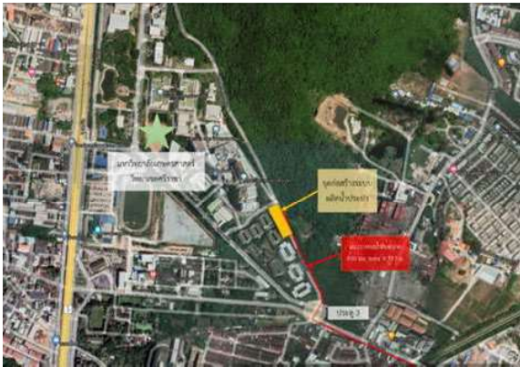
ภาพที่ 3 แสดงจุดก่อสร้างระบบผลิตน้ำประปาภายในมหาวิทยาลัยเกษตรศาสตร์ วิทยาเขตศรีราชา

น้ำประปาแบบ Mobile Plant ขนาดกำลังการผลิต 2,400 ลบ.ม./วัน (100 ลบ.ม./ชม.) ได้อย่างเหมาะสม ดังภาพที่ 3 และภาพที่ 4