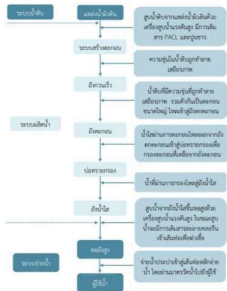
ภาพที่ 5 กระบวนการผลิตน้ำประปา